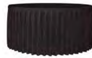
table cover 0141 1028 1027 0144 0142 0146 0145 tablecloth 0552