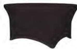
table cover 0233 1020 1018 1017 0230 1019 0229 top cover 0473 1024 1022 1021 0470 1023 0469