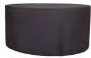
table cover 0362 1026 1025 0365 0363 0367 0366 tablecloth 0552